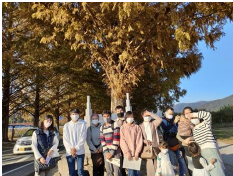
(ベトナム人10人、インド人1人が参加しました。)

「近くで紅葉を見るところはありますか?」そんな声から始まった企画です。滋賀県でおすすめの紅葉を調べてみると、1位(または上位)にメタセコイヤ並木がランクインしていることをご存じでしょうか? 市内バス利用促進のための「バス無料DAY」のこの日、マキノ駅に集合し、バスでマキノピックランドへ紅葉狩へ行きました。無料バスの車内で配布されたサービス券を使ってジェラートを食べたり、メタセコイヤ並木を散歩したり、たくさん写真を撮ったりなどして楽しむことができました。