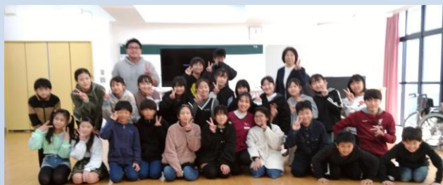
(青柳小、本庄小の皆さん)

この日介護をして貰う役をした教師の方はアインさんの丁寧なゆっくりした言葉遣いに心も温かくなったそうです。